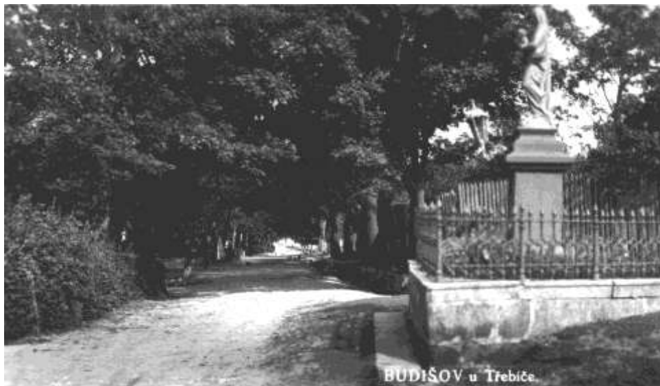
Madona Immaculata z r. 1883 v Budišově, původní orientace