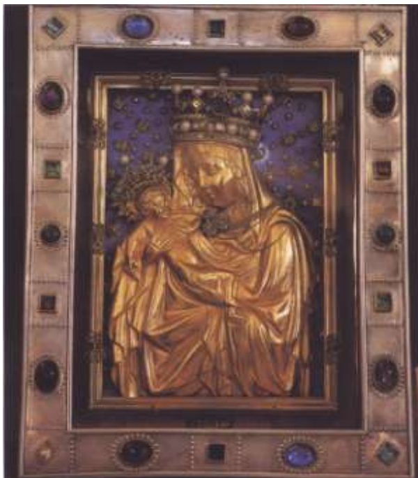
Palladium (záštita) země české, gotický reliéf Panny Marie ze Staré Boleslavi z přelomu 14. – 15. století

Provedené práce nadchly nejen budovatele, ale i ostatní obyvatelé. Tehdy se uvažovalo o obdobné úpravě pahorku s Nejsvětější Trojicí. Další schodiště mělo usnadňovat přístup pro zbožné rozjímání u sochařského zpodobení mnohých svatých, kteří byli vybráni jako ochránci Budišova a jeho obyvatel. Ještě v období mezi dvěma světovými válkami se konala vždy 16. května procesí s pobožností u sochy sv. Jana Nepomuckého. Tehdy bývalo celé prostranství oploceno a průvod přicházel od kostela horní brankou. K vybudování schodiště nedošlo, lid pozbyl zbožnosti a volně přístupný pahorek slouží po léta omladině k zinním radovánkám. Dole pod Sv. Trojicí byl zbudován památník padlým občanům v obou světových válkách.