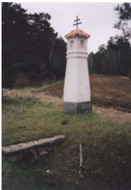
Boží muka u rudíkovského nádraží

Krátkým prudkým stoupáním se ocitneme v krajině klidu a ticha, tak silně kontrastující s předcházející rušnou státní silnicí. Zde by to chtělo sesednout s kola (pokud se tak již nestalo v prudkém stoupání) a kolo vést až ke klesání před Hodovem. Je na co se dívat. Po pravé straně se objeví Hodovská horka (581 m), která se obdivuhodně vzpamatovala po vichřici v roce 1985. Patří spolu s Vlčatínským vrchem (590 m) k nejvyšším bodům této oblasti. Před lesy po levé straně