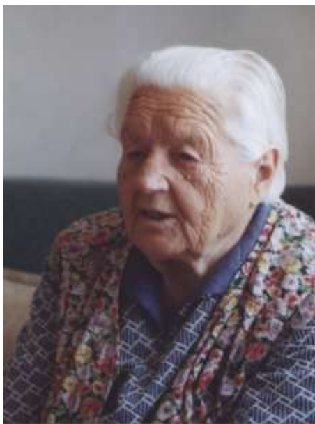
Fotografie z roku 2000