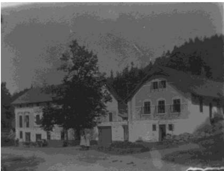
Jelínkův mlýn (asi z roku 1933)

loupačka. Při mlýně bývala i listová pila. Původně měl mlýn pět kamenných mlýnských složení a čtyři vodní kola na spodní vodu. Válcové stolice nahradily kamenné mlýnské složení, stolice byly žitné a pšeničné. Žitná měla kovové válce se šikmým rýhováním s rozdílným počtem otáček. U pšeničné byly válce hladké – keramické. Semletí jedné dávky vyžadovalo 6–8 průchodů mlecími válci a vysévači, až zbyly jen slupky. V době 2. světové války byl lístkový příděl potravin, ale to nestačilo lidem k obživě. Nedostatek potravin vytvářel stále větší tlak a naléhání obyvatel donutilo mlynáře, aby i za cenu velkého rizika mlel mouku na černo. V roce 1943 se ve mlýně objevila hospodářská kontrola s příslušníky německého četnictva. Mlynář Jan Jelínek byl za porušení říšských zákonů odsouzen a uvězněn na Mírově. V těch dobách si člověk nemohl být jistý ničím, a tak mlýnská chasa, příbuzní a známí lidé s napětím čekali, jestli se mlynář skutečně po výkonu trestu vrátí. Na začátku roku 1945, kde se vzal tu se vzal, objevil se ve mlýně zbědovaný a vyhublý. Byl všemi srdečně vítán.