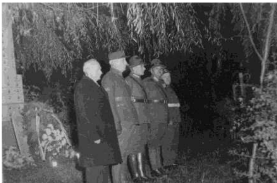
U pomníku padlých v Budišově