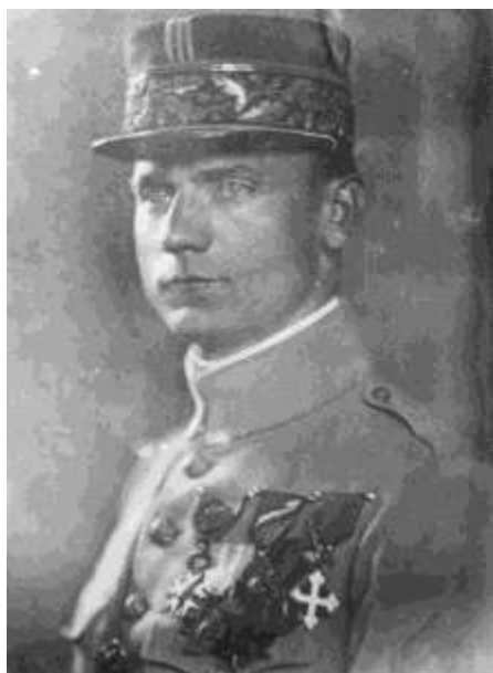
Gen. M. R. Štefánik