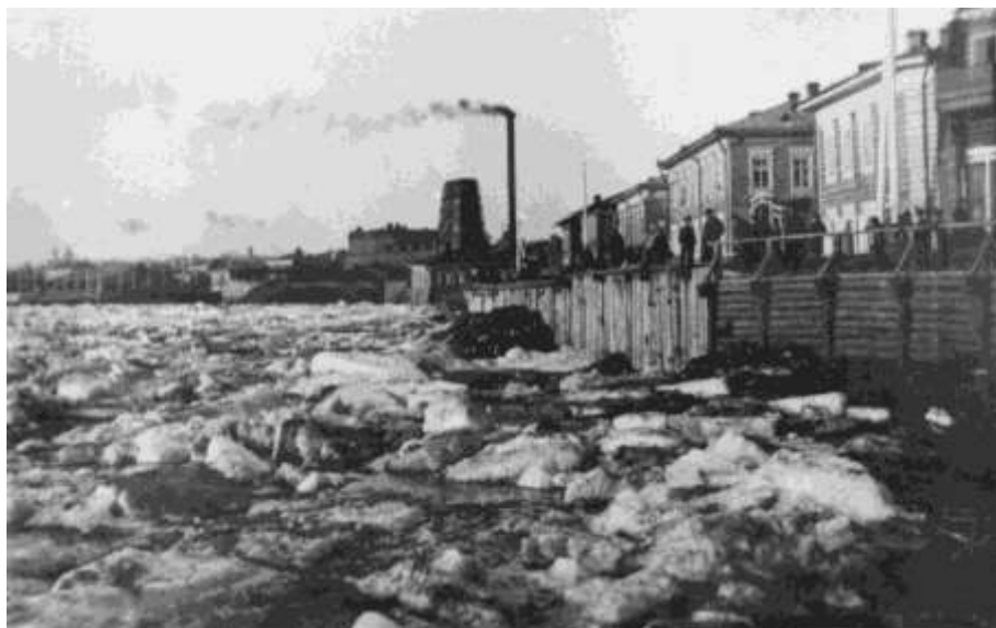
Ledy na řece Tom u Tomska