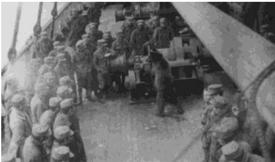
Zábava s medvědem