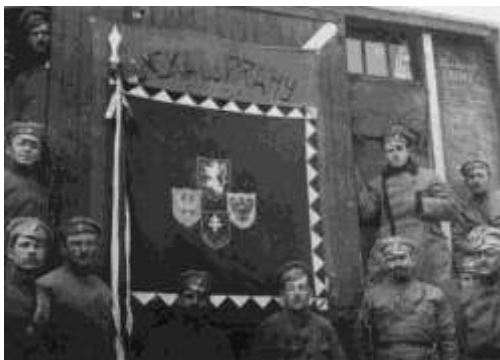
8. rota, br. Tesaf J. z Budišova