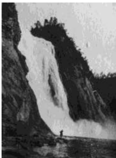
Vodopád u Quebecu