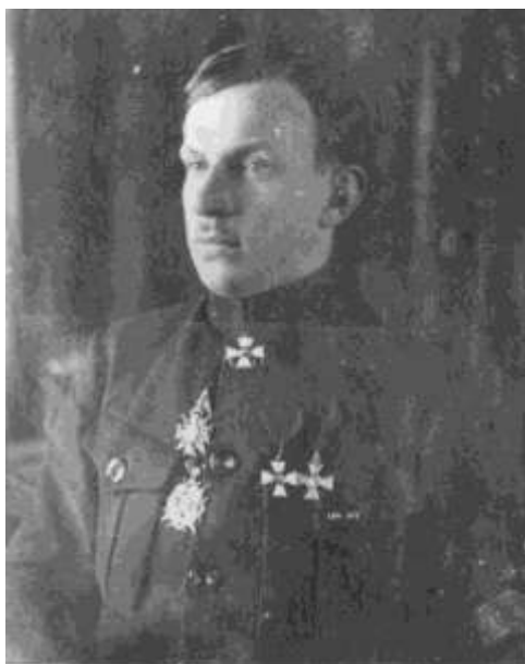
Gen. R. Gajda