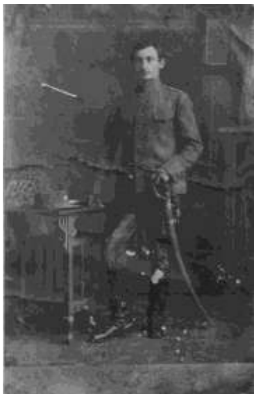
V zajetí, výcházková pracovní uniforma

Narozen 9. 6. 1895 ve Vídni (Dol. Rak.), bydliště Kojatín (samota Spálený dvůr). Vyučil se kolářem a povoláním byl státní cestář.