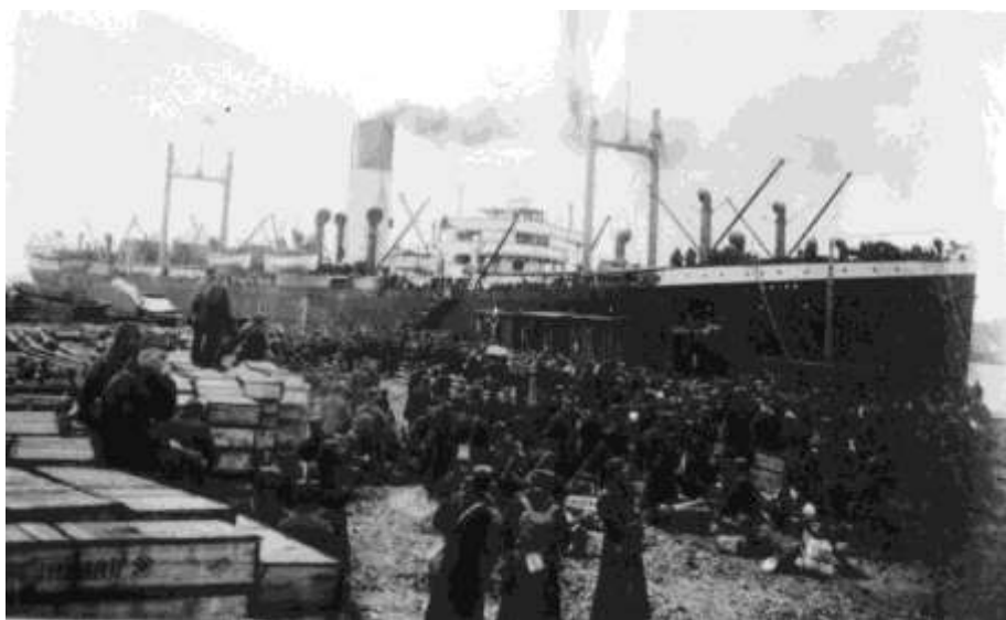
Návrat 7. pl. do vlasti r. 1920, loď Ixion, ve Vladivostoku 23.V.1920