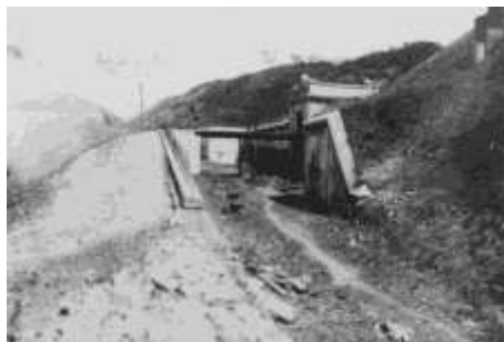
Pevnost u Vladivostoku – Gornostaj