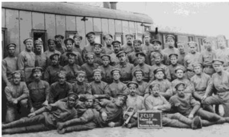
6. rota 7 p. pl. Tatranský