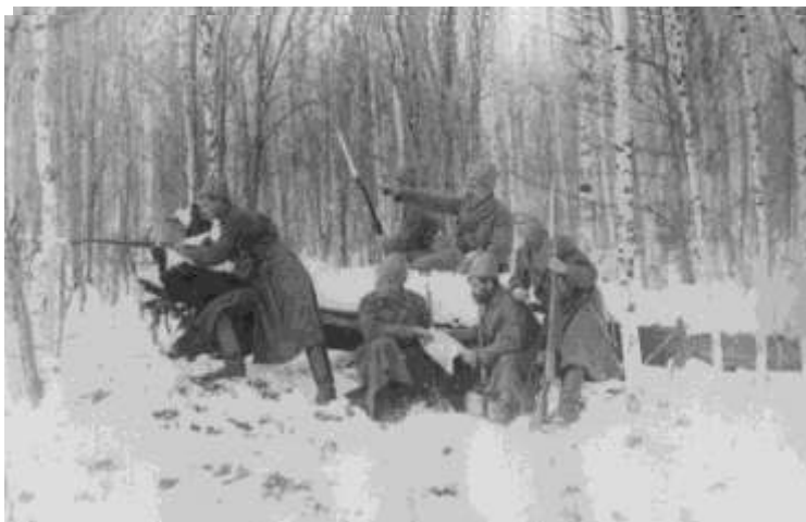
Hlídka v lesích na Urale – 7 p. pl.