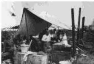
Kuchyně 6. roty na Valcartier