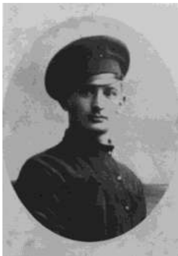
Zajetí, v pracovní uniformě

Po připlutí do Německa nastoupili do vlaků (zbraně museli nechat v zadních vagoněch), které je po různých přestupech dopravily na československé území. Jejich prvním místem, kde získali azyl, byla pevnost Josefův u Jaroměře. Když si šli pro své zbraně, zjistili, že zbraně i s vagony zůstaly v Německu. Bylo to v důsledku obav našich vládních činitelů, aby jim legionáři po návratu nezpůsobili nějaké těžkosti.