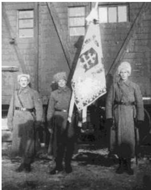
Prapor 7. p. pl. tatranský