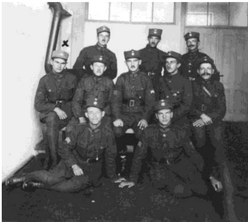
× bratr Chyba