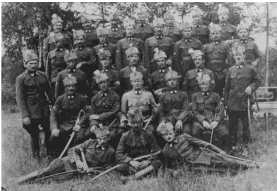
Jako legionář, v horní řadě, druhý zprava

Z pevnosti Josefov je propouštěli do jejich bydlišť po desíti lidech a to ještě na různé strany. Tím pádem to trvalo ještě nějaký měsíc, než se konečně dostal domů. Psal se rok 1920.