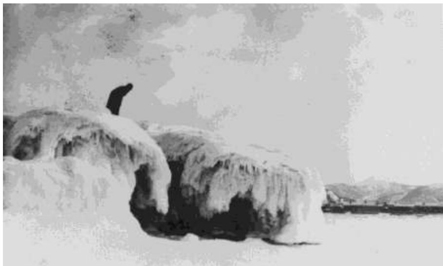
Ledovce na jezeře Bajkal