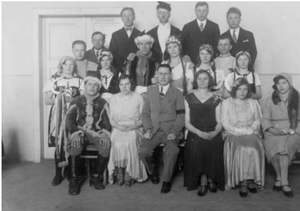
Představení Polská krev

Sokol: Ach ta láska od Štolby; Kráska ze Šumavy; Dědkové; Ondráš, pán Lysé Hory; Sýkorka strýce Tobiáše; Mamzelle Nitouche; Pekel nevěsta a Za protekcí.