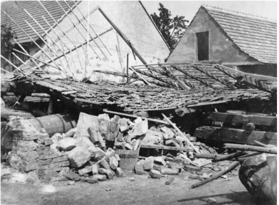
Zničená kůlna rolníka Zezuly

Dne 4. července o 8 hod. večer strhla se velká bouře, liják a vichřice, jaké není pamětníka. Celý den bylo jasno a horko. K večeru o 8 hod. přihnál se mrak, nastala ohromná vichřice, blesk za bleskem děsil, strhl se liják. Byly vyvráceny stromy, jako javor před Kašparovými, v panské zahradě 4 stromy, křídlice na střeších sházeny, např.