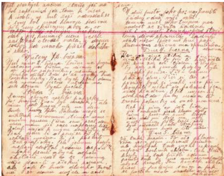
Stránky deníku – originál

Jest podvečer a vane teplý vánek. Naše postavení je bezvýchodné, jsme obětí sojuzníka a jich spekulací? Máme ochraňovat ruskou inteligenci, která se hrubě chová a odnáší to náš prostý lid.