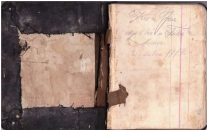
Titulní strana deníku