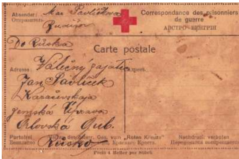
Dopisnice – ilustrační foto

Bolí mě ruka v loktu. Když jsem byl v lázních ve Lvově, ujela mně tam noha a já jsem upadl na loket pravé ruky. Loket mě bolel, dlouho nemohl jsem si o něj zavazit. Po čase se mně zahojil, ale kost na tom místě bolí stále. Nyní to bude již tři měsíce a u lokte pod kůží se mně podlila krev. Dnes ráno jsem to propíchl, vyteklo mnoho krve. Nevím, co z toho bude, mám obavu, aby se mně nenakazila kost.