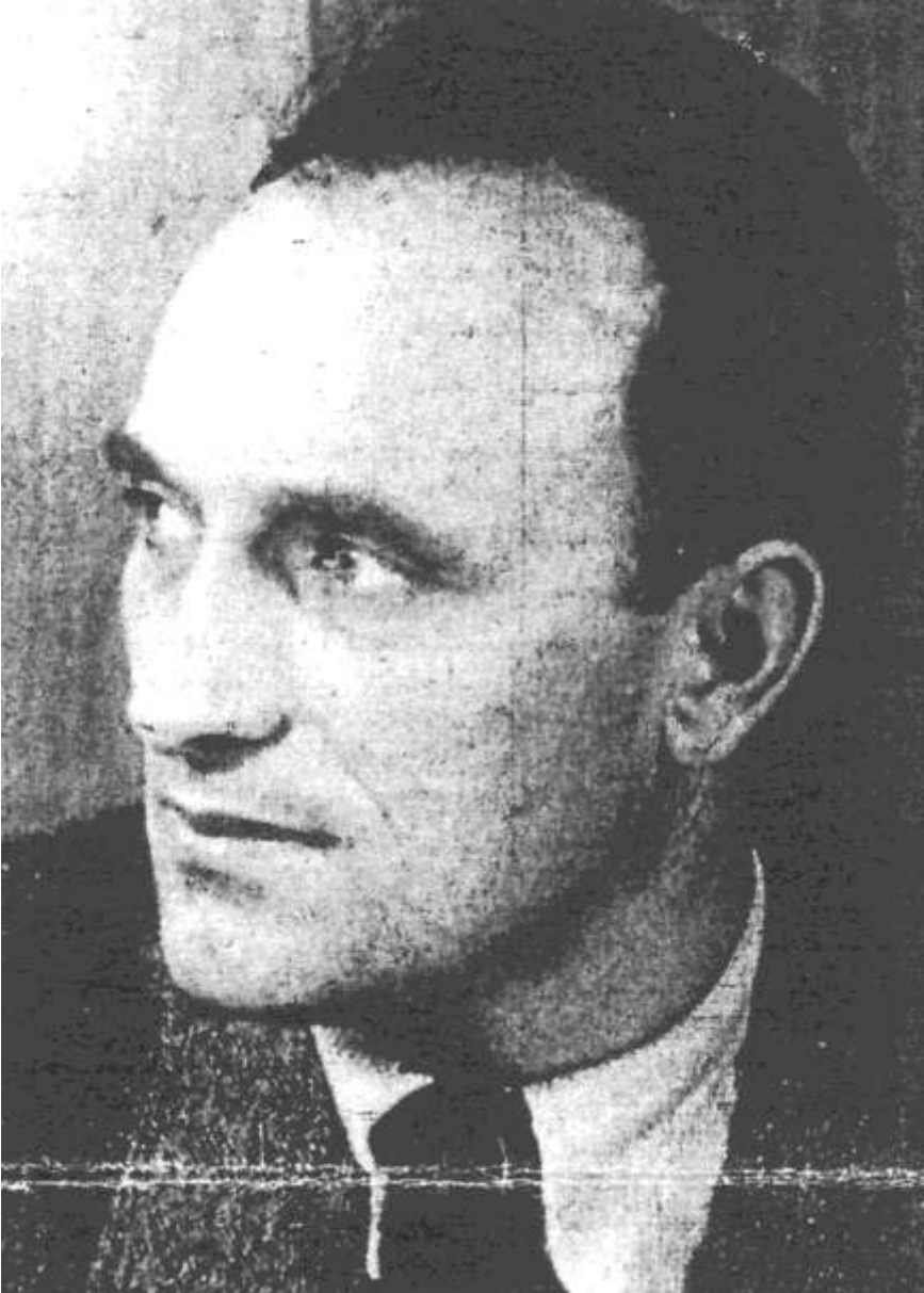
Jedna z posledních fotografií