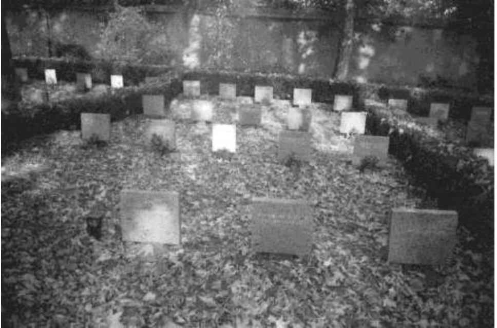
Praha (Děblice) – hřbitov, sektor politických vězňů