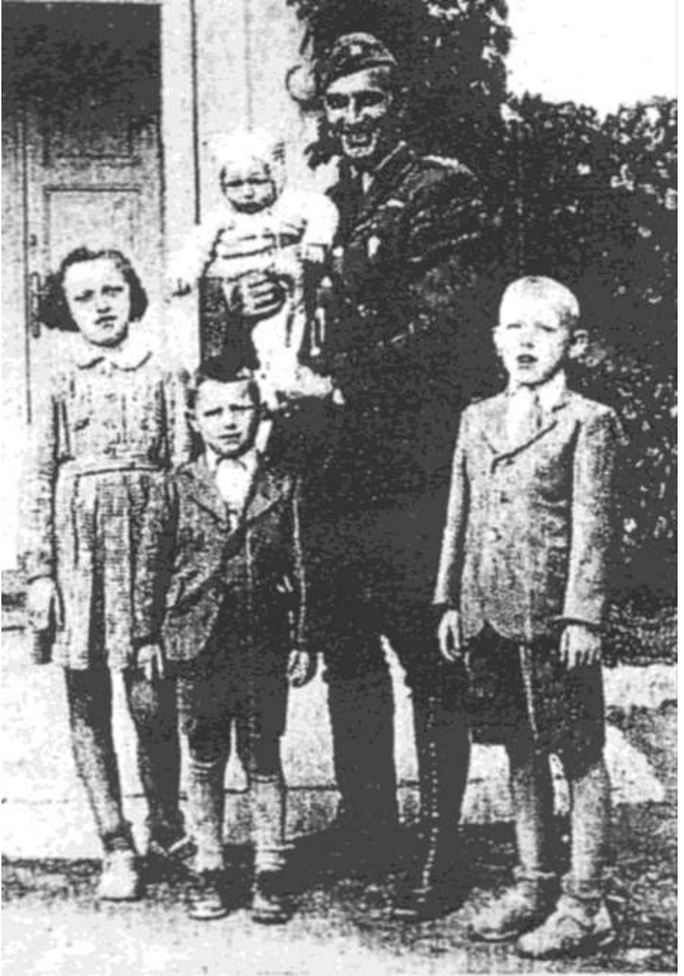
Setkání s dětmi