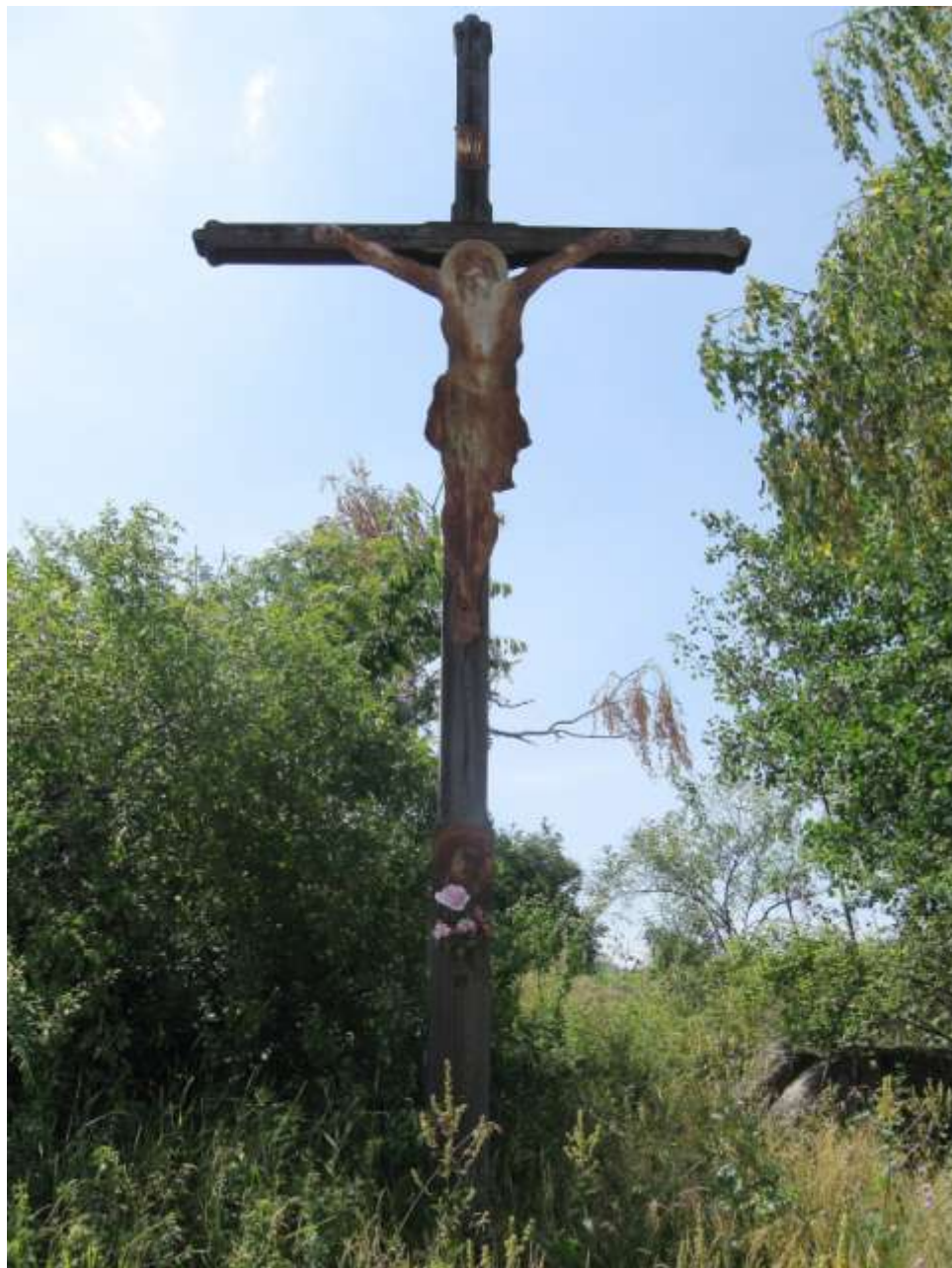
Velký dřevěný kříž Bednářův, mezi Hodovem a Náramčí byl postaven v roce 1992 (před tím tam byl dřevěný kříž, který stal naproti, přes silnici, kde spadnul). Byl vyroben truhlářem Kotačkou z Hodova.