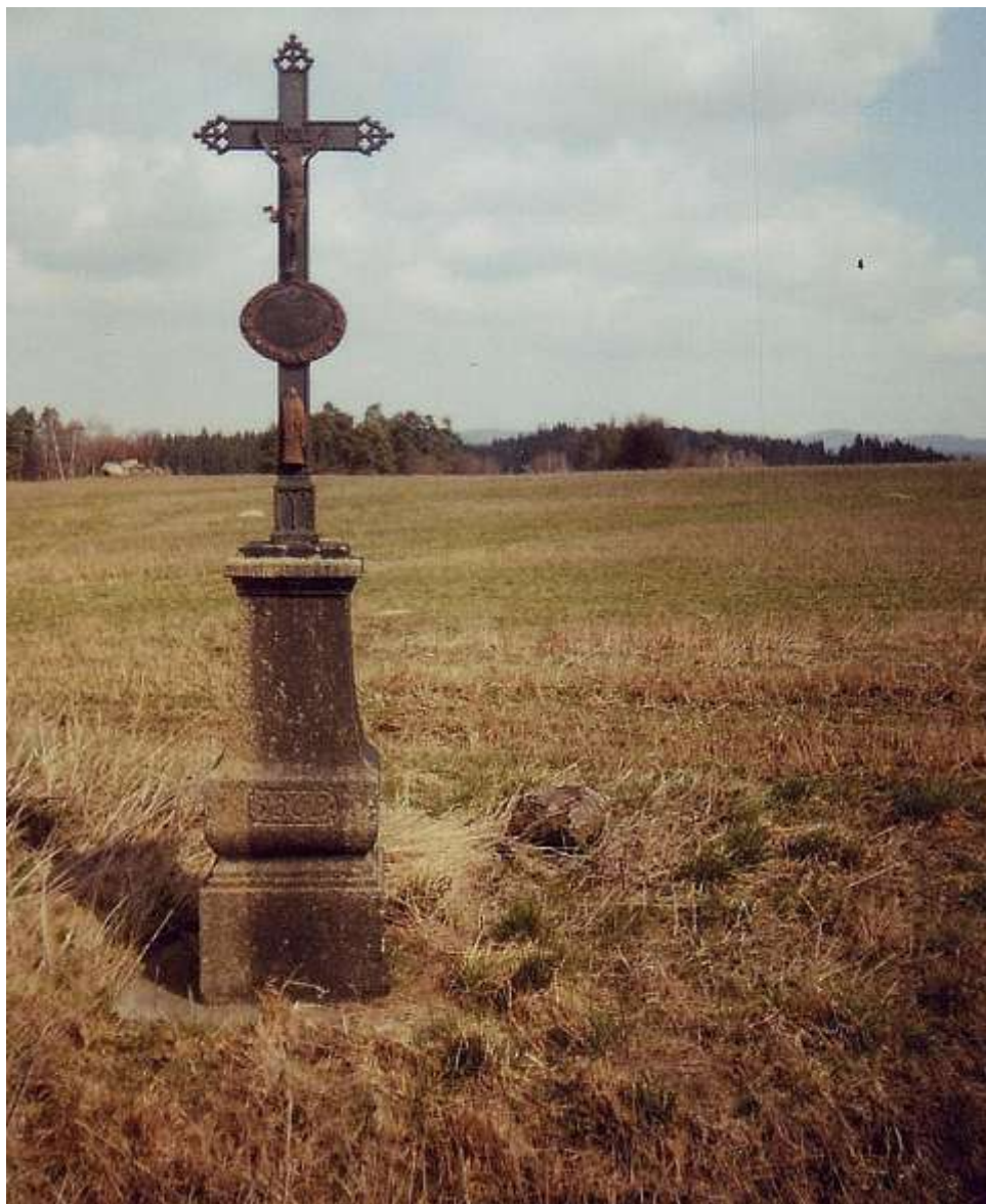
Železný kříž u silnice z Hodova na Oslavičku, blíž k Rohům, má na podstavci letopočet 1868.