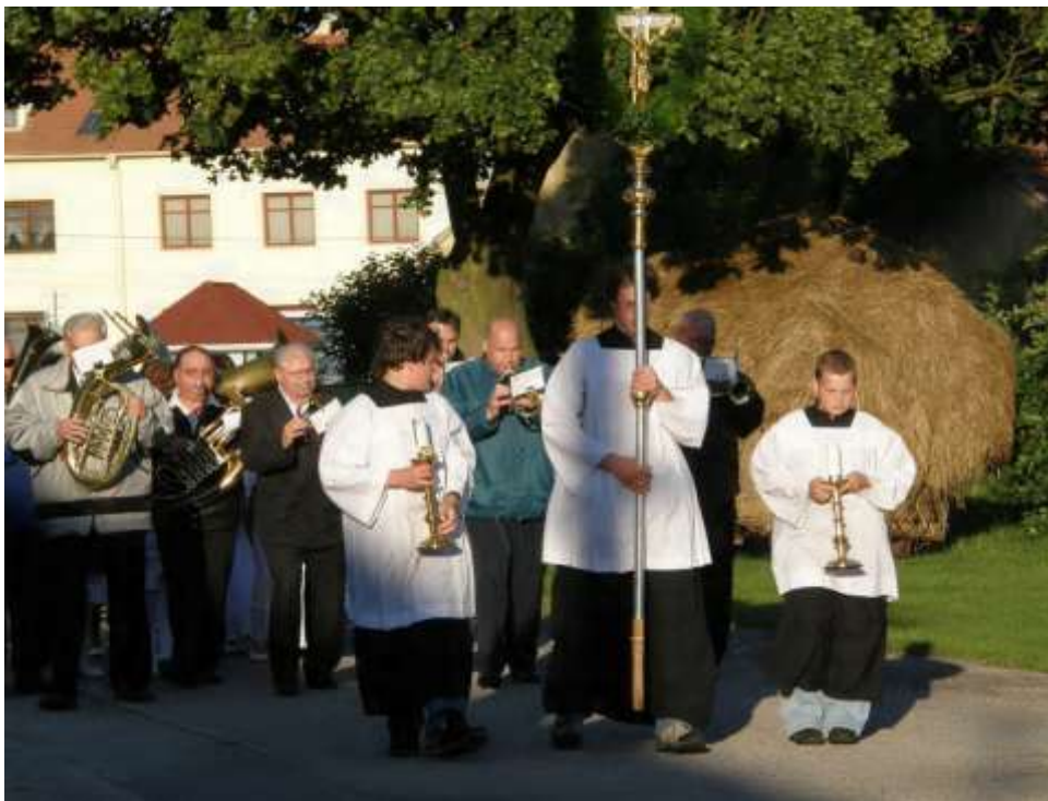
Boží Tělo 2009