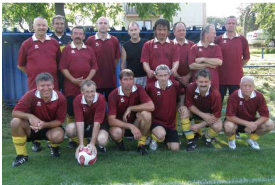
Staří páni Budišov u Třebíče