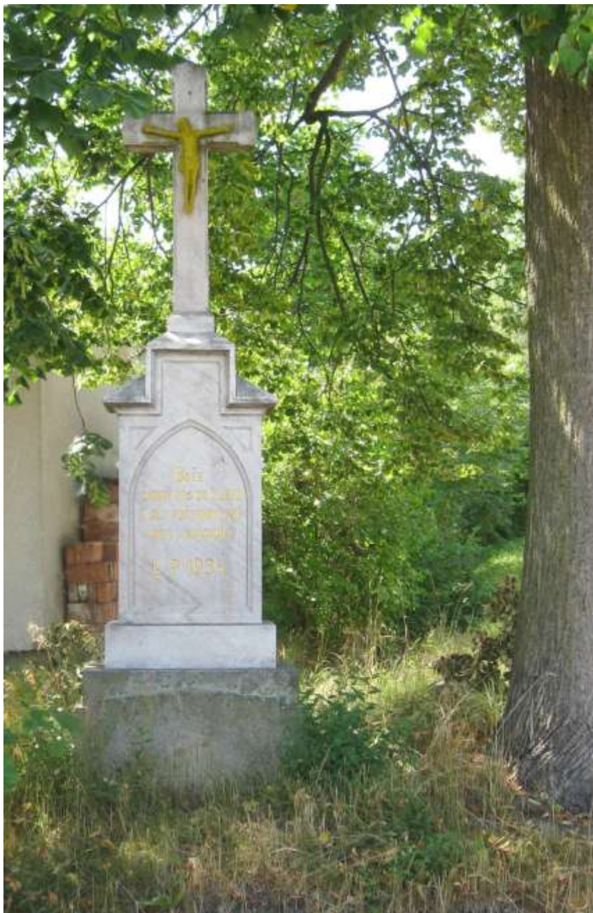
Mramorový kříž v Hodově, při cestě do Náramče má nápis: „Bože chraň nás od zlého a dej požehnání nám i budoucím, 1934.“