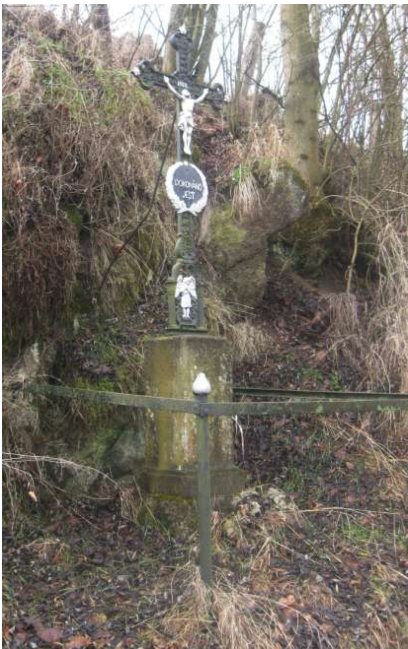
Železný kříž v Rozích, u silnice zde stával již v roce 1927. Na tabulce má nápis: „Dokonáno jest.“