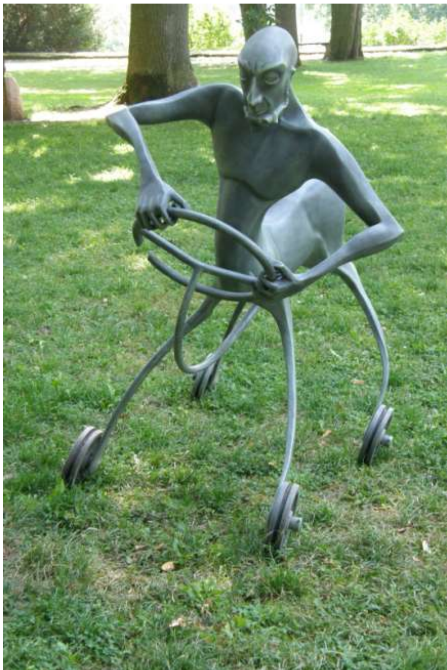
Libor Hurda KENTAUR (... hlavně hlavou)