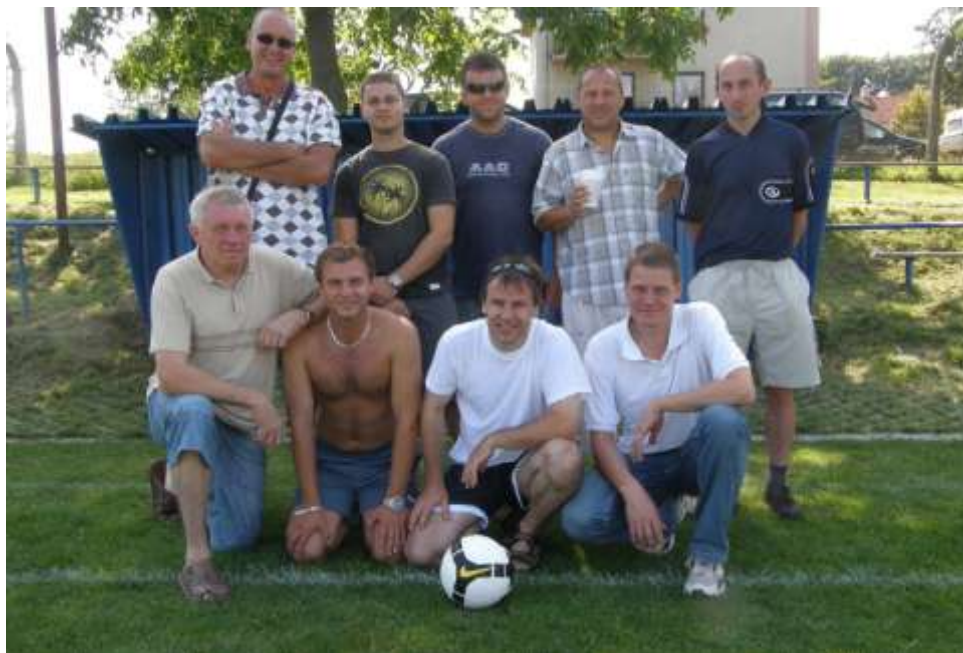
Staří páni Brno