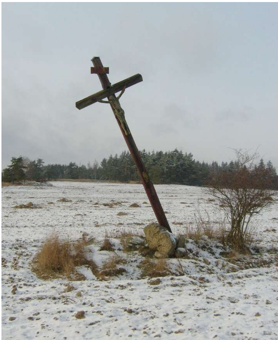
Dřevěný kříž v polích poblíž lesa Ochoz, dnes již hodně nakloněný, byl postaven v roce 1947.