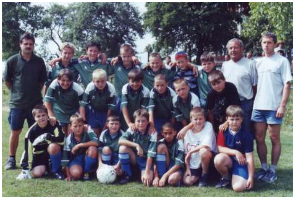
Jako trenér – horní řada, druhý zprava