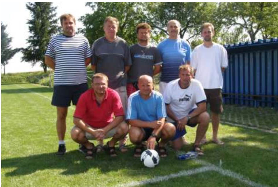
Staří páni Koněšín (část mužstva)

Ve druhém utkání se střetla mužstva Dukly Brno a Budišova nad Budišovkou. „Vojáci“ byli v prvních dvaceti minutách jasně lepším celkem, ale tři „tutovky“ jejich hráči neproměnili, a tak přišlo na řadu staré fotbalové pravidlo „nedáš – dostaneš“. Po rohovém kopu hráčů Budišova nad Budišovkou nastal v pokutovém území Dukly zmatek zakončený střelou do horního rohu branky a obránce „Brňáků“ míč z brankové čáry vyrazil rukou. Následnou penaltu hráč Budišova bezpečně proměnil. V druhém poločase již na hřišti existovalo jen jedno družstvo a Budišov nad Budišovkou jasně zvítězil 4:0.