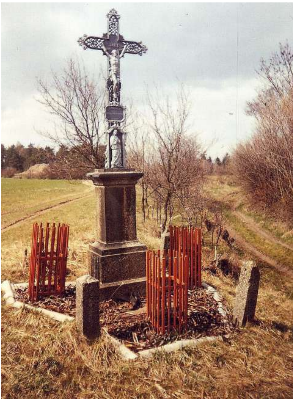
Železný kříž hned za obcí věnovala rodina Brodských.