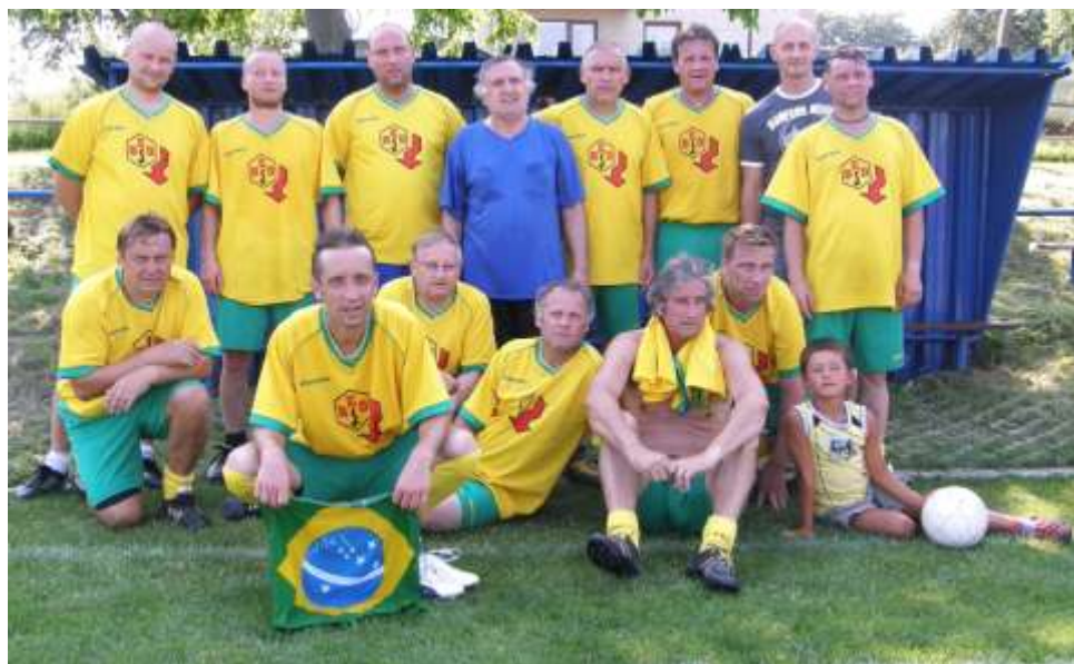
Staří páni Budišov nad Budišovkou