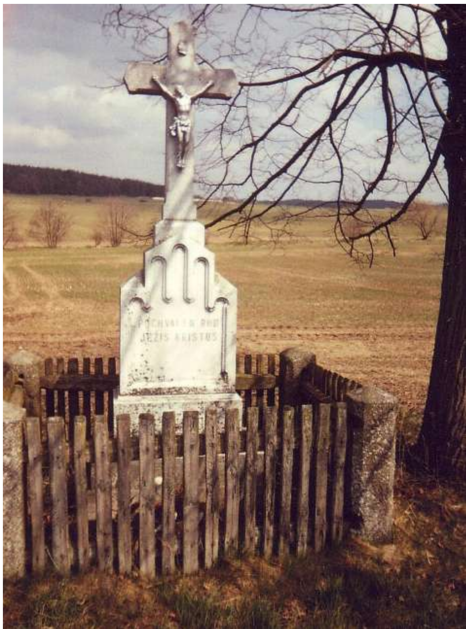
Kříž mramorový u potoka Mařek Za Nivou má nápis: „Pochválen buď Ježíš Kristus, 1969 kříž postavil Musil z Hodova.“ Dříve v těchto místech stával kříž zvaný Markův, který spadnul.