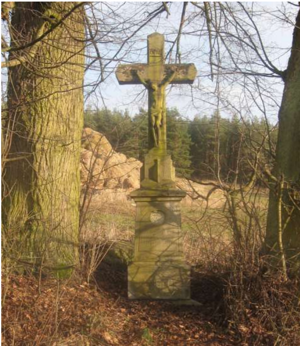
Kamenný kříž za Rohy, u silnice do Studnic, má nápis: „Utrpení Kristovo posílí mne. V ranách svých ukryj mne. Ó dobrý Ježíši vyslyš mne, R. 1920.“