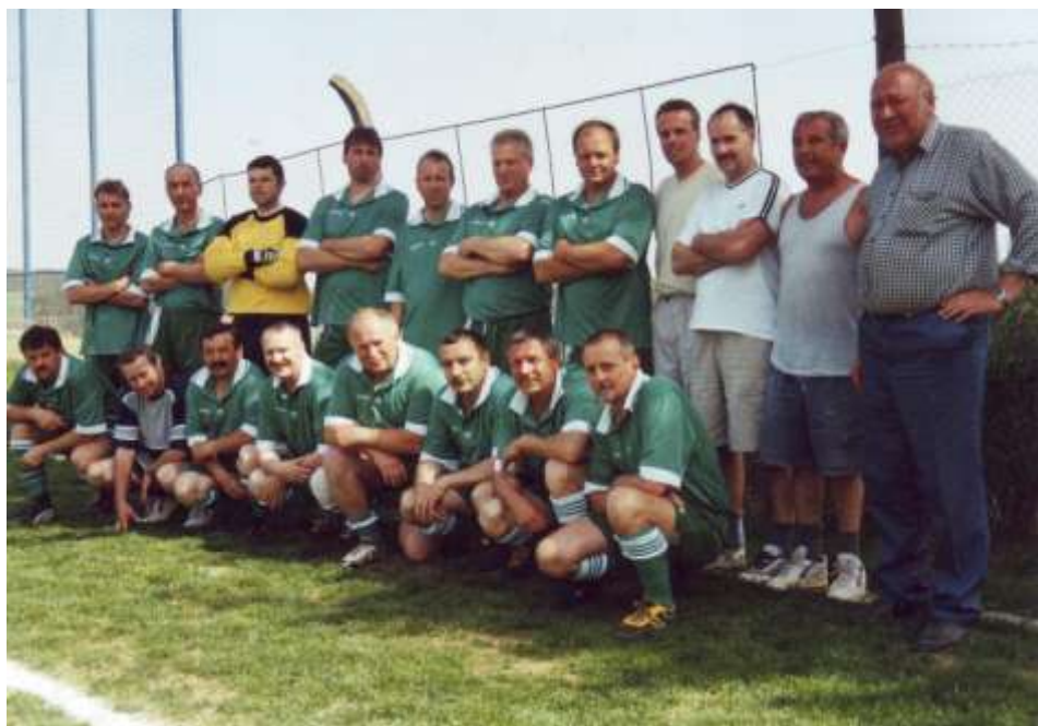
Staří páni – druhý zprava