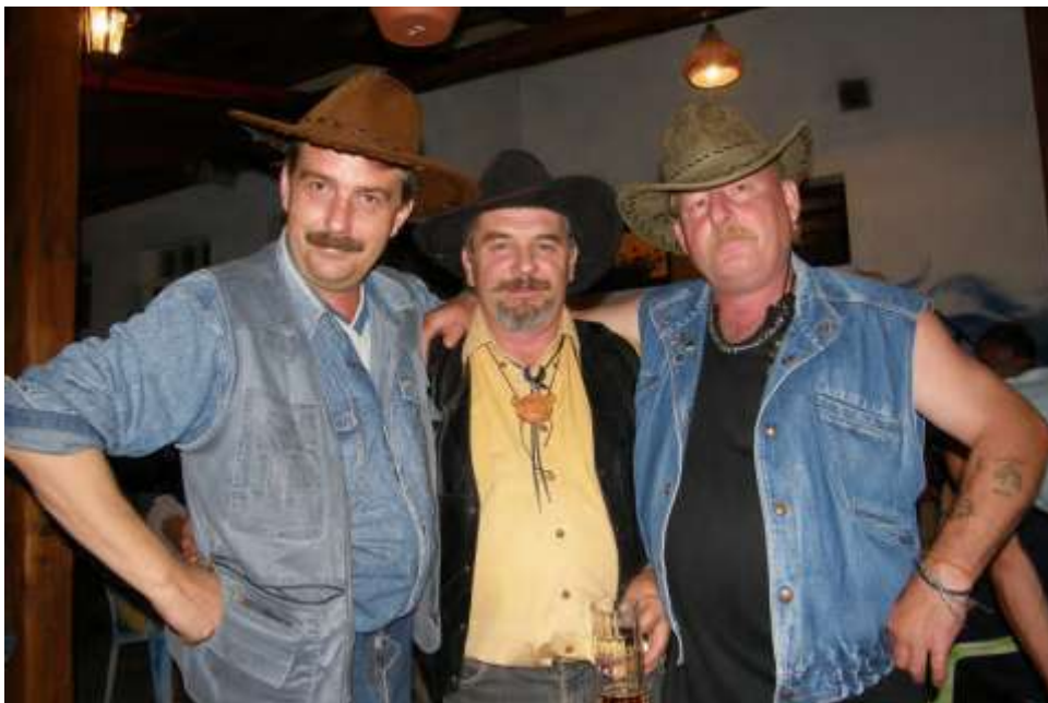
Na představení country kapely Na starý kolena ( zahrádka, restaurace U Kazdů )