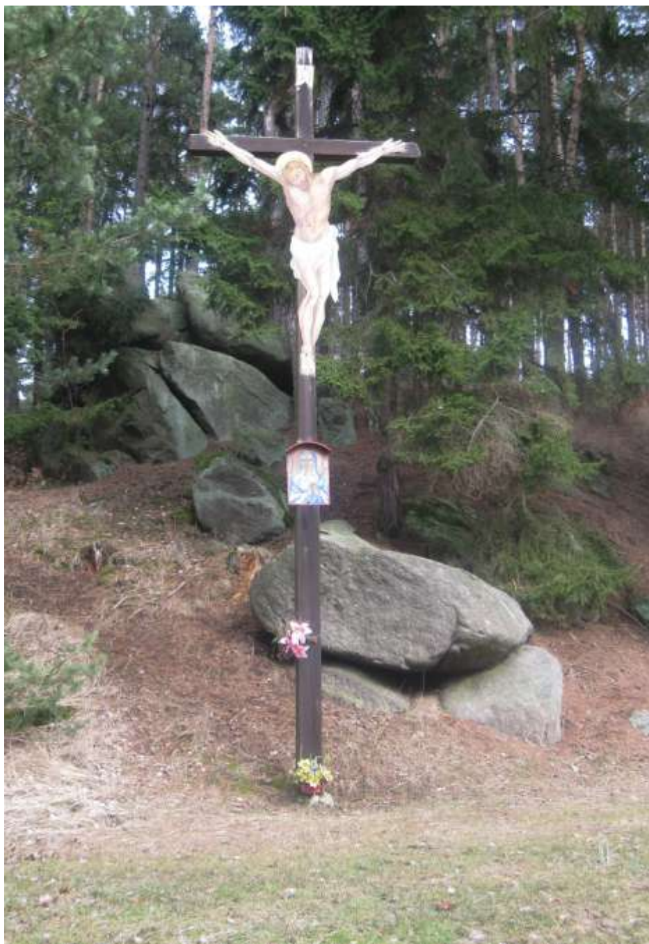
Dřevěný kříž u potoka mezi Rohy a Hodovem (blíž Rohům) byl postaven v roce 1995.